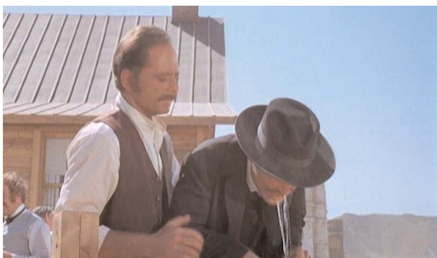
Foto 12: “Doc” tiene un intenso ataque de tos y expulsa el whisky, que está bebiendo, por la boca

Tras un ataque de tos en su habitación, baja al saloon . En la barra piensa mientras juega con el agua que dejan en la superficie el fondo de los vasos húmedos. De repente sale y va en busca de Kate que está “trabajando”. La toma a cuestras y la lleva a su hotel. A la mañana siguiente, le regala un precioso vestido blanco y la lleva a una casa que ha alquilado para ambos. En el camino Wyatt, que ha estado viendo un cartel para su campaña, no puede ocultar su desagrado cuando los ve besarse. Para desesperación de “Doc” la casa está tan sucia como una pocilga.