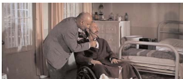
Foto 8: el médico ausculta a “Doc”

Es una tuberculosis avanzada, de mal pronóstico, “Doc” lo sabe y se siente desahuciado. Su final no lo recoge la película pero se da entender que será próximo.