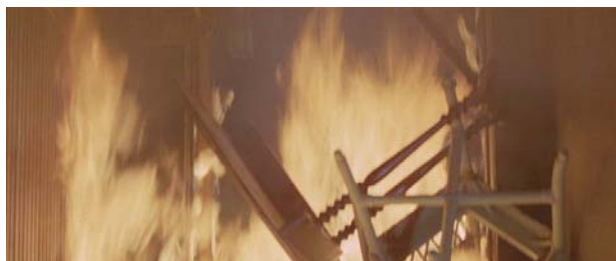
Foto 10: Eddie quema la casa de sus padres

El acto de quemar el chalet es un símbolo de “ruptura” con el pasado y de “renacimiento”, desde la nada. Este elemento simbólico también es usado en El compromiso cuando Eddie se refugia en casa de sus padres y quema los documentos mercantiles de la ruinosa empresa de alfombras de su progenitor, y el fuego posteriormente se extiende destruyendo la casa paterna donde vivió sus primeros años de vida Eddie. (foto 10). Es un rito de destrucción de una forma de vida que no desea continuar, un acto de rebeldía ante un padre que no le permitía desarrollar sus inquietudes artísticas como escritor, como una forma de romper con el pasado.