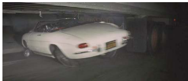
Foto 2: el protagonista intenta suicidarse estrellándose con un camión

Eddie sufre una segunda crisis cuando su padre ingresa en el hospital. Al visitarlo se enfrentan