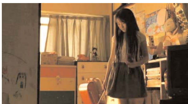
Foto 3: ... por su hermana asmática con un objeto punzante

El desarrollo ulterior demostrará que estamos ante un caso del síndrome atípico, la autora no es la madre, sino la niña que murió de una crisis asmática. Esta infligía daños físicos variados a su hermana más pequeña con el fin de que la curasen en el hospital, (fotos 2 y 3). En una de estas agresiones, la madre la dejó sola y no le dio el aerosol de su broncodilatador para llevar a la pequeña, a la que acababa de agredir al hospital. En estas circunstancias, la crisis asmática le produjo la muerte.