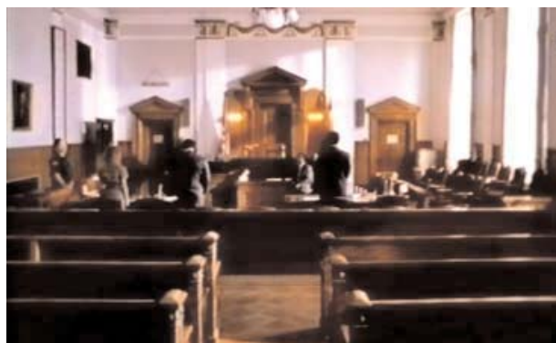
Foto 10: empieza la vista judicial