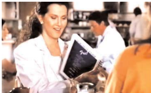
Foto 7: la perpetradora intenta ganarse a la doctora regalándole un plano de Denver

A partir de este momento la madre intenta intimar con Paula, le regala un mapa de Denver para que