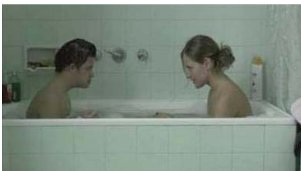
Foto 5: las pulsiones sexuales de León quedan al descubierto en muchas escenas

en el piso de Jonathan. Este intento no cuaja, ¿Por qué se muere Jonathan? ¿Por falta de apoyos que le animen y motiven a continuar? ¿No se toma en serio su intento de emancipación? Lo que se pone de manifiesto es que tampoco está cómodo en su situación de dependencia. Una nueva crisis amenaza a Olvido al ser despedida de su trabajo en un taller de confección y se agrava por la noticia de la marcha de su novio Iván y su negativa a vivir juntos. Culpa de ello a su hermano, quien siempre es el objeto de su ira cuando fracasa en cualquiera de las parcelas de su vida, lo que motiva un nuevo intento de deshacerse de él. Víctima de la presión a que se encuentra sometida prepara una sobredosis de pastillas mezcladas con un zumo para envenenar a su hermano. Ante la negativa de este a tomar el brebaje, utiliza el chantaje emocional para que se lo tome [usa el amor incondicional de León y sus necesidades sexuales (foto 5) ofreciéndole la posibilidad de mantener relaciones sexuales incestuosas]. A pesar de estos intentos de deshacerse de él no existen reproches por parte de León a su hermana, sólo piropos y cariño.