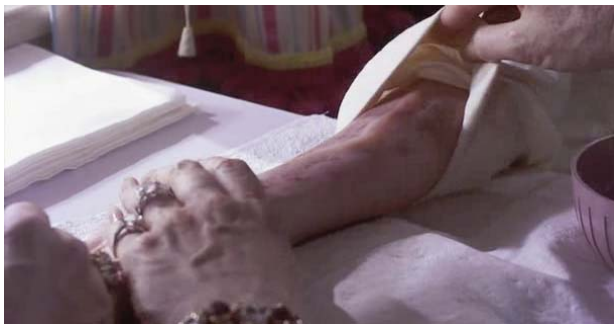
Foto 4: Shelby presenta en uno de sus brazos cicatrices y hematomas por la hemodialisis

madre se recupera muy bien y ella en apariencia también. Shelby está muy contenta, se ve con fuerzas, hace la vida que siempre había hecho y cuida de su hijo con el que se siente inmensamente feliz.