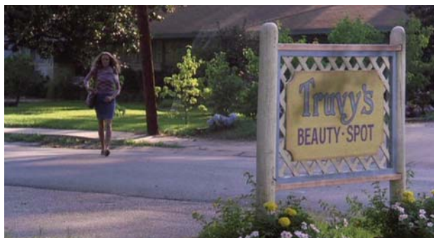
Foto 2: el salón de belleza de Truvy, lugar que juega un papel esencial en la acción

La película comienza el día que Shelby va a celebrar su matrimonio. Mientras Truvy la peina sufre