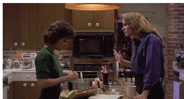
Foto 6: el rostro de M'Lynn muestra gran preocupación cuando su hija le dice que está embarazada

La diabetes mellitus engloba a un conjunto de procesos metabólicos cuyo nexos es la mala regulación del nivel de glucosa en la sangre. Su incidencia ha ido creciendo y es un importante problema sanitario en la actualidad. Afecta cada vez más a niños, desde edades tempranas, y a adolescentes. Sus efectos son importantes en el día a día y a la larga. M'Lynn tiene claro que una diabetes mal controlada es un cuadro grave y diversas escenas captan la preocupación que muestra su cara ante la incertidumbre de la evolución de la enfermedad en su hija (foto 6).