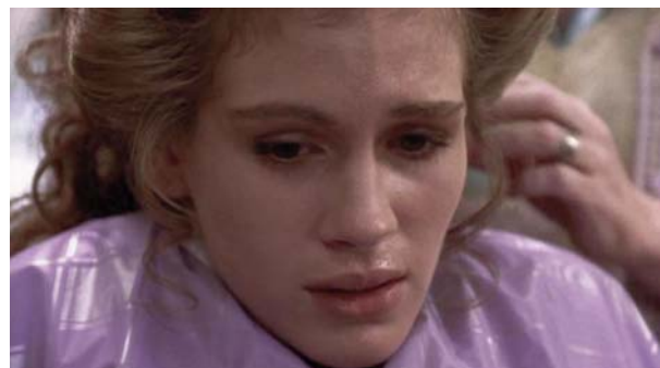
Foto 3: en un episodio de hipoglucemia Shelby muestra sudor frío, mareo y desorientación

una hipoglucemia (una bajada del azúcar de la sangre) (foto 3). Esta escena pone de manifiesto que la protagonista es una persona enferma que sufre una diabetes. Además por la forma con la que responden su madre y sus amigas el mal viene de largo y es por todos conocido. Se celebra la boda y todos los invitados celebran el acontecimiento con gran alegría.