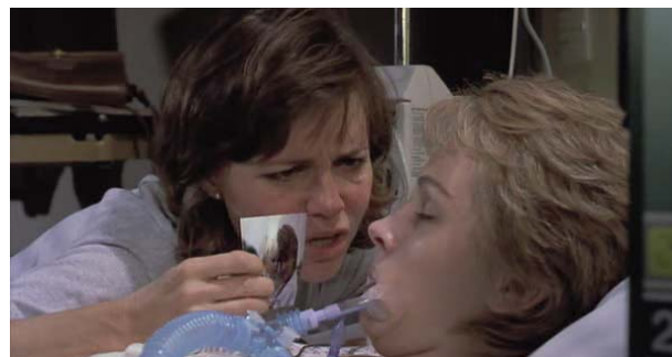
Foto 9: M'Lynn le muestra fotografías de su hijo a Shelby en coma

a su lado permanentemente, no se aparta de ella ni un segundo ( ...y si se despierta un momento y yo no estoy aquí ), la moviliza, le habla, le lee revistas, le muestra fotografías de su hijo..., siempre hay un lugar para la esperanza (foto 9). Pasan los días y no despierta, por lo que deciden que lo mejor es desconectar el respirador que la mantiene con vida. Su marido firma los documentos.