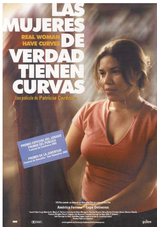
Cartel español con la protagonista