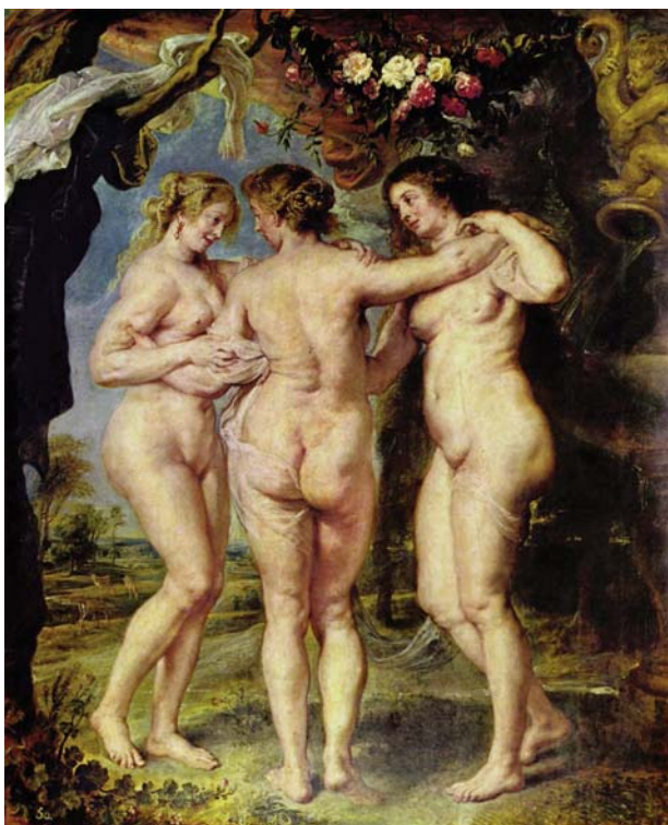
Foto 10: el canon de belleza femenina tradicional: obsérvese en Las tres gracias (1638) de Peter Paul Rubens (1577-1640) (Museo del Prado, Madrid)

considerado el valor más importante en lo personal. Esto sumado a conductas sociales tendentes a la obesidad, conlleva a extremos que conducen a la aparición de diferentes patologías a fin de alcanzar el modelo exigido por la sociedad muy difícil de lograr. La adolescencia es posiblemente la etapa más vulnerable por su sensibilidad y su deseo de aceptación y en donde es posible que se desarrolle la aparición de mayores trastornos como bulimia, anorexia o trastornos de la conducta que condicionan riesgo de vida.