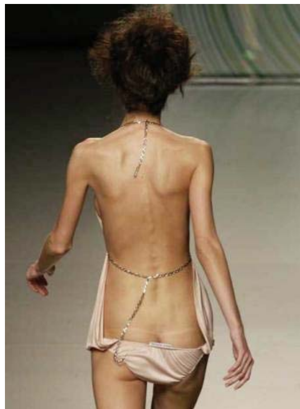
Foto 11: el nuevo canon de belleza femenina y las modelos con delgadez extrema

Por otro lado en una actitud contradictoria del mercado occidental, ha aumentado la oferta de productos alimenticios de costo bajo pero que carecen de calidad alimentaria. De acuerdo a esta premisa es común que la juventud deba recurrir a la elección de comidas rápidas basadas fundamentalmente en hidratos de carbono a un costo económicamente menor pero que predisponen a la obesidad. Sería necesario crear una educación alimentaria a partir de las premisas nutricionalmente correctas es decir, calidad y cantidad de alimentos suficientes como por ejemplo el de las carnes, frutas y verduras. Sin embargo a la hora de elegir los mismos el costo de ellos es más elevado obligando al individuo de condiciones socio-económicas más limitadas a elegir alimentos basados en hidratos de carbono que, ingeridos en cantidades inadecuadas, conducen a la obesidad.