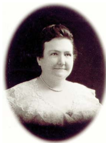
Foto 1: Cecilia Grierson (1859-1934).