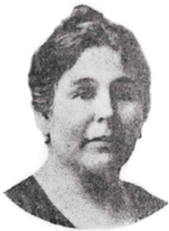
Foto 2: Elvira Rawson Guiñazú (1867 -1954).

Elvira Rawson Guiñazú , nacida en Buenos Aires en 1864 (foto 2), decidió ingresar en la Facultad de Medicina de la Universidad de Buenos Aires. Sin apoyo familiar alguno, ya que la oposición de tal núcleo fue terminante, se empleó como maestra en una escuela de Barrio Norte, aprobó nueve asignaturas de equivalencia para acceder a la Facultad, fue la única mujer entre 84 hombres en el primer curso, y la segunda profesional graduada después de Cecilia Grierson, en 1892, con la tesis: "Apuntes sobre la higiene en la mujer". En 1890, participó activamente en la Revolución del Parque, insurrección cívico-militar producida el 26 de julio de 1890 y dirigida por la recién constituida Unión Cívica, liderada, entre otros, por Leandro Alem. Durante esa jornada, integró con médicos, todos adherentes como ella a tal entidad política, un hospital de campaña en el frente de batalla para atender a los heridos de uno y otro bando en pugna. Posteriormente a la Revolución, la Unión Cívica se fracturó en Unión Cívica Nacional y Unión Cívica Radical. Esta última, en la que