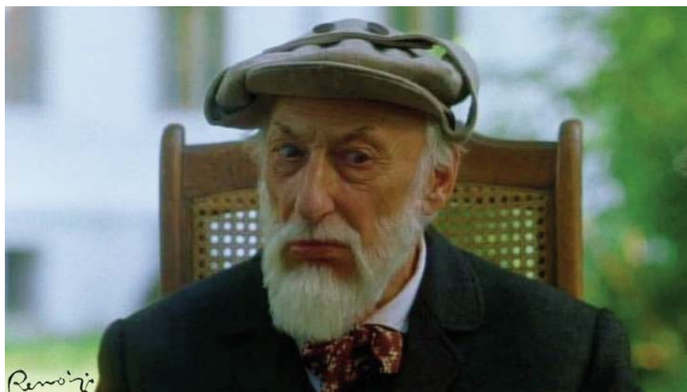
Auguste Renoir (1841-1919)...