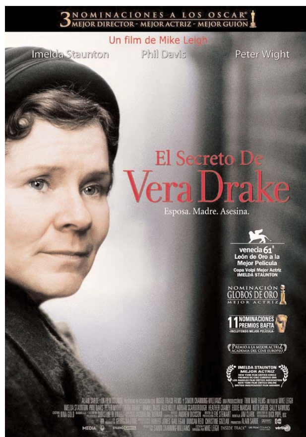
Vera Drake (Imelda Staunton). Cartel español

Para Vera, la razón por la que la policía ha ido a su casa es por ayudar a chicas jóvenes cuando no se pueden