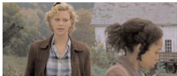
Foto 7: Candy explica a Rose su experiencia (aborto) e intenta ayudarla

de una gestación. Ante la presencia de vómitos, Homer sospecha su estado y le pregunta de cuánto está y si lo sabe, en clara alusión a su embarazo. Después de admitirlo, Rose plantea en voz alta el problema que la atormenta: ¿Qué voy a hacer con un bebé? No puedo tenerlo . Homer le pide que no haga nada ella sola y le ofrece su ayuda: Si decides no quedarte con el bebé, sé donde puedes llevarlo . Tan pronto Candy conoce el estado de Rose, le cuenta que ella también se quedó embarazada hace un año y le ofrece ayuda: Si no quieres tener el bebé, Homer te llevará a un lugar donde estarás segura... (foto 7). Cuando le pregunta sobre la paternidad del futuro bebé, la mirada de la joven (excelente ejemplo de comunicación no verbal), descubre que su embarazo es fruto de la relación incestuosa y no deseada con su padre, el Sr. Rose.