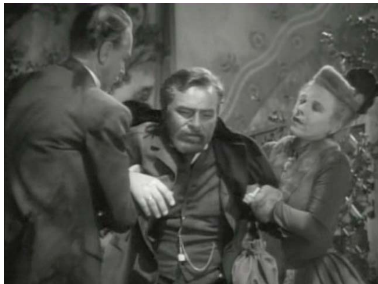
En la celebración mientras baila con su mujer tiene un desvanecimiento. Sufre una tuberculosis pulmonar a causa de su trabajo con el bacilo.