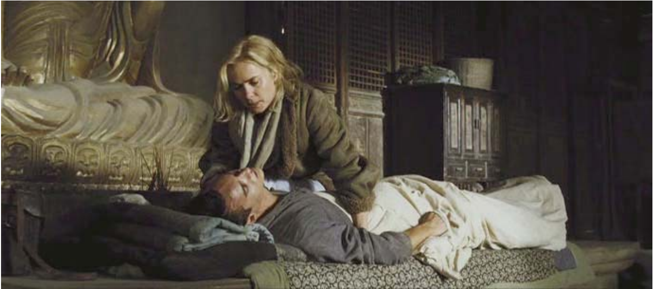
rigidez de nuca,