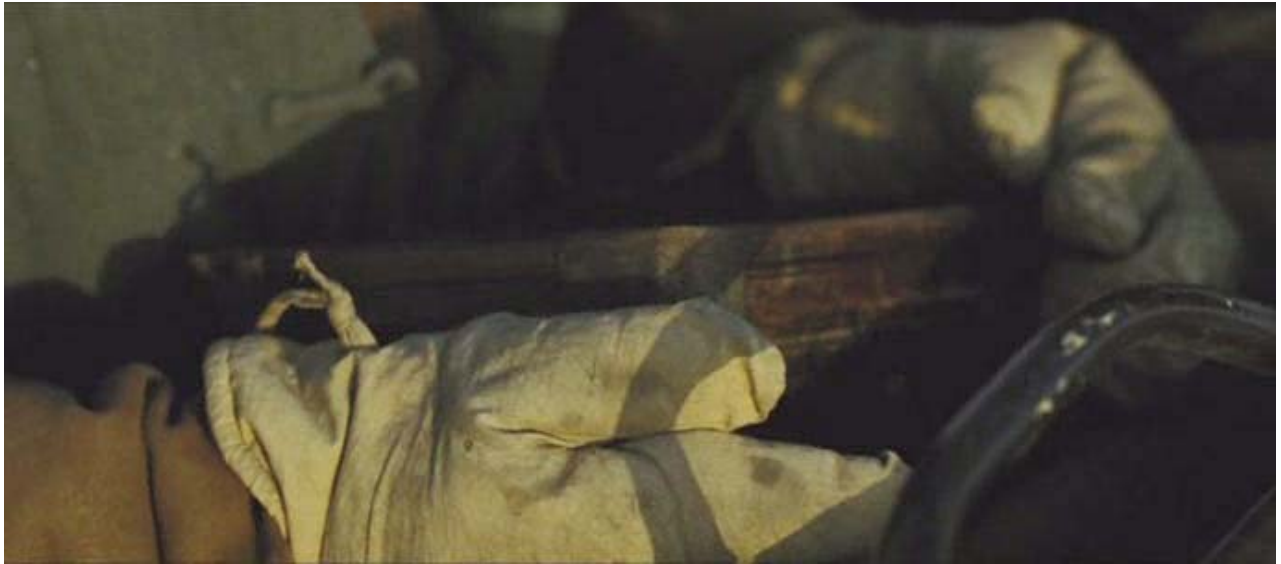
Como tardaron en conseguir el suero antitetánico...