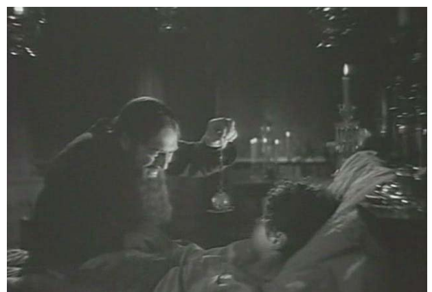
Foto 2: la hemofilia del zarévich Alexis y Rasputín en Rasputin y la zarina .