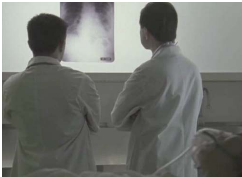
La mayoría de los pacientes con SARS desarrollan una neumonía grave.