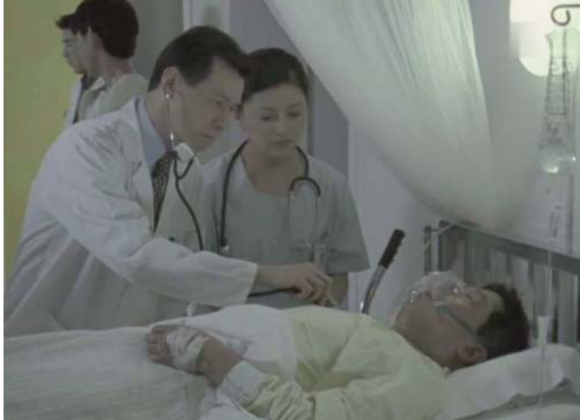
Síntomas: dificultad respiratoria.