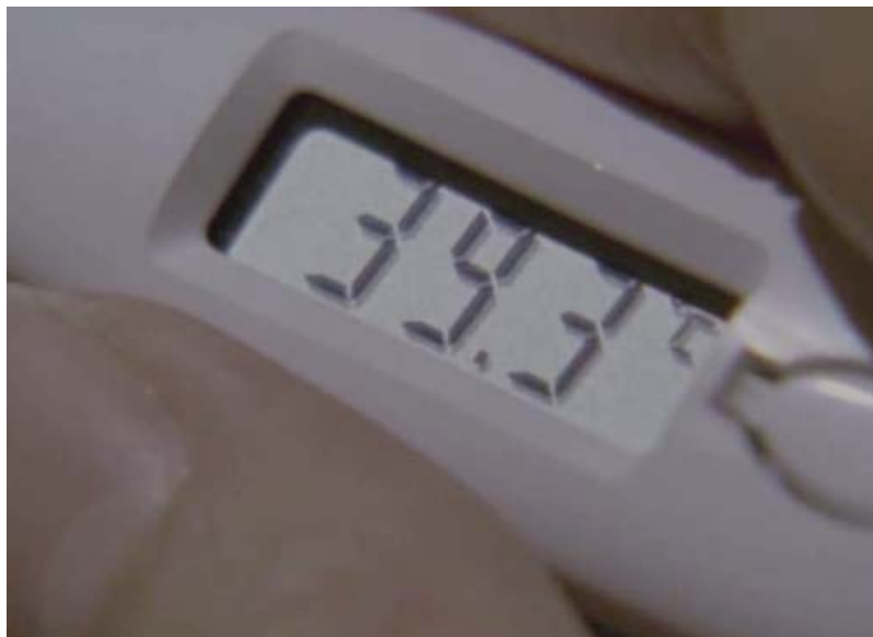
Síntomas: fiebre alta.