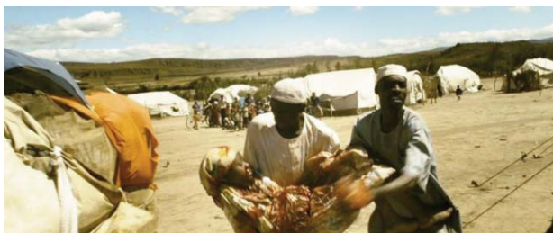
Foto 4. Llegada de una segunda víctima al campo de refugiados.