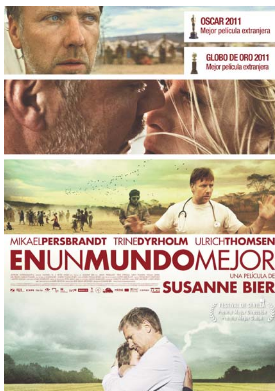
Cartel de la versión española.