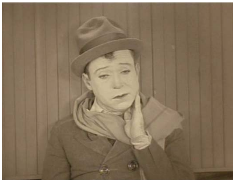
Dolor de garganta.