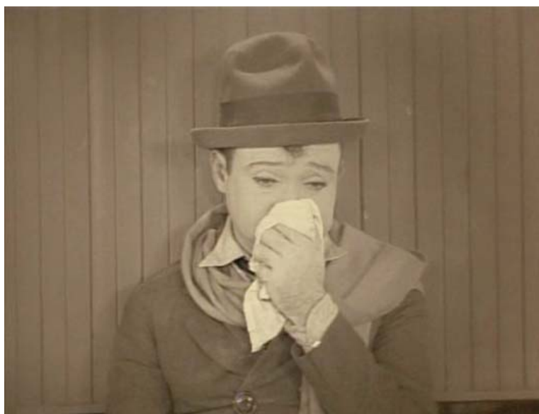
Rinorrea (goteo nasal).