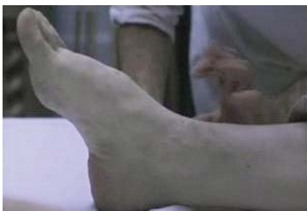
Foto 4. Pié con malformación congénita antes de la cirugía.

Bajo presión psicológica el farmacéutico obtiene un permiso oral de su empleado para someterse a una