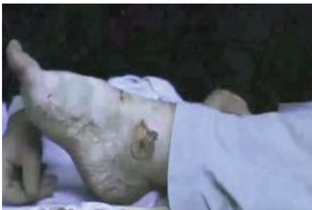
Foto 5. Pié después de la cirugía realizada por Charles Bovary.

Durante cuarenta y tres días Emma esta febril y delira y le diagnostican una “fiebre cerebral”. Durante todo este tiempo Charles permanece al lado de la cama cuidándola. Deja de atender a sus pacientes, su clientela disminuye, la desorganización de la casa crece y aumentan sus gastos de tal forma que comienza a tener dificultades financieras.