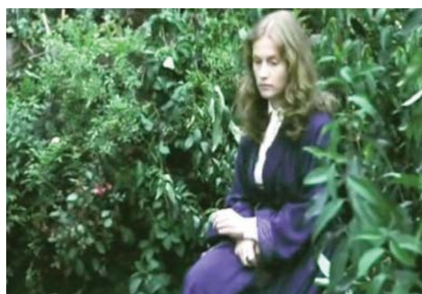
Foto 2. Emma Bovary en una fase depresiva con la facies característica.

Emma intenta aproximarse y rescatar Charles durante un tiempo. Finalmente desiste. Se la ve entonces claramente deprimida e introspectiva (foto 2).