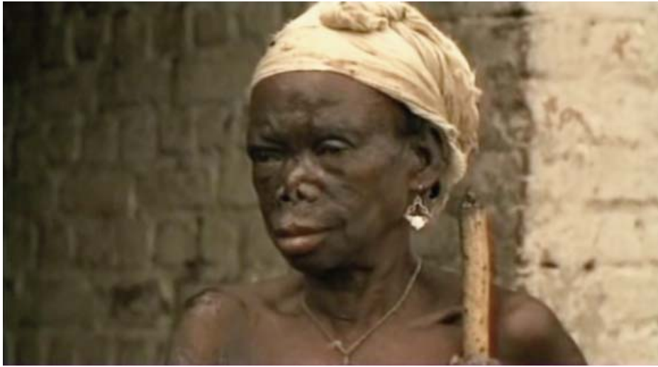
Afectación del tabique nasal.