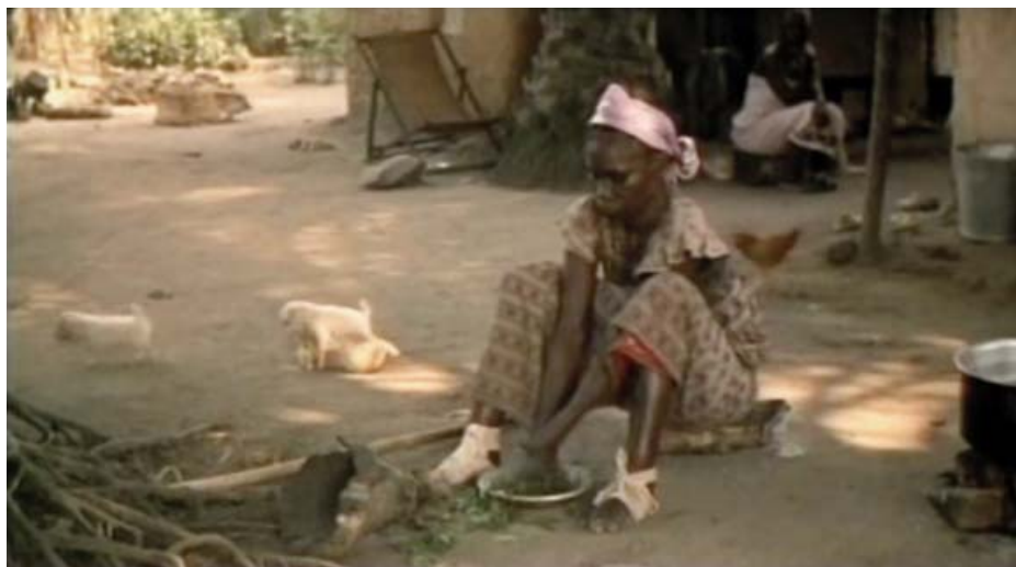
Amputaciones de los dedos de la mano y úlceras crónicas en los pies.