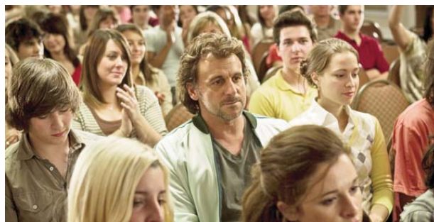
Foto 3. Convención de jóvenes que quieren conocer la identidad de Starbucks.

Cuando David sigue al joven con varias relaciones amorosas, termina ingresando a la conferencia a la cual se dirigía, y se sorprende al ver que todos los asistentes tienen la misma edad, incluso rasgos muy parecidos. El sonido de las palabras de la presentación se va haciendo más claro, poco a poco, hasta que el efecto de sorpresa estalla: está en una convención de los 142 jóvenes que quieren conocer la identidad de Starbucks (Foto 3).