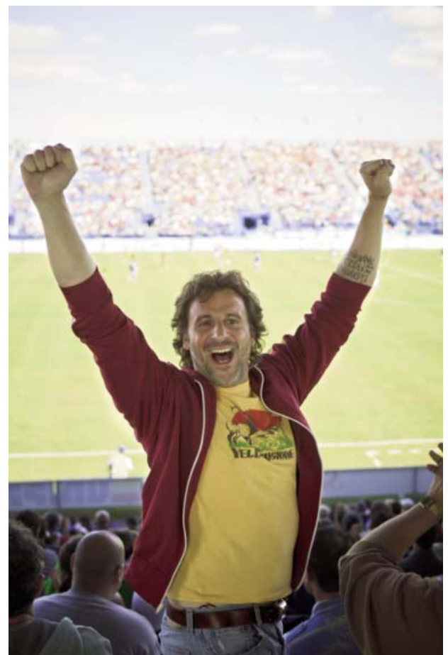
Foto 2. Ingreso a la paternidad por la vía imaginaria.

En el siguiente encuentro, se hace pasar por repartidor de pizza para ver a una chica que termina