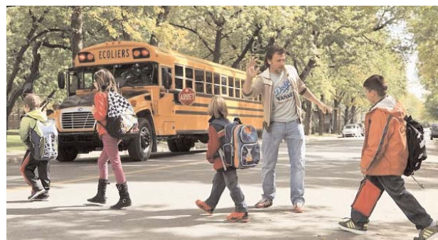
Foto 5. Nuevas maneras de enfrentarse a la paternidad.

Los criterios morales que aparecen a lo largo del film responsabilizando a Starbucks por las múltiples