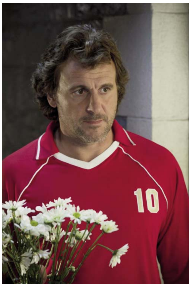
Foto 1. David se entera que su novia Valérie está embarazada.

En esta posición está instalado (Foto 1) hasta que un día su novia, Valérie, le devela que ha quedado embarazada y que piensa tener a su hijo independientemente de lo que él decida, y a su vez, recibe la noticia de la demanda de 142 jóvenes, que engendrados con su semen veinte años atrás, quieren conocer la identidad del donante que se ha autodenominado Starbuck. El abogado