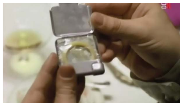
Foto 4. Mechero-preservativo que regala la protagonista a su pareja.