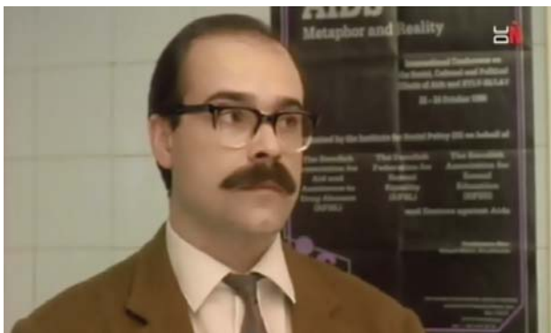
Foto 3. Poster sobre congreso del SIDA en la consulta.

En el año de la presentación de la película (1987) (foto 3), hay un total de 624 casos reconocidos y declarados en nuestro país desde 1981 7 . Ese mismo año, en Europa se habían contabilizado 5.687 casos, (de los cuales, casi el 60% eran varones; bien homosexuales y/o heterosexuales, el 14% a drogadictos y el 4% a hemofílicos) y en el mundo se habían registrado en torno a 60.000 casos, la mayoría en EEUU 4 .