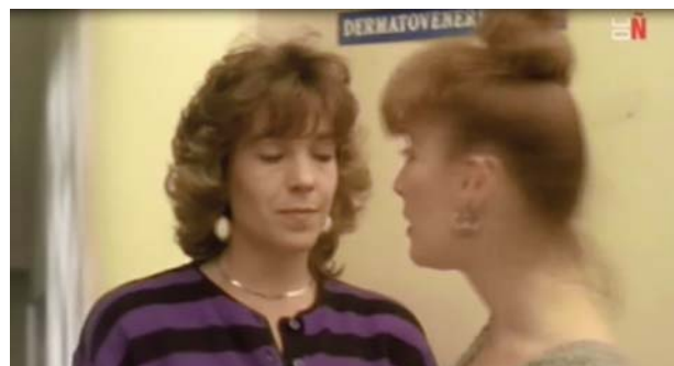
Foto 1. Dermatovenéreas aparece en la puerta de la consulta.

En la actualidad, la mayor parte de las infecciones de transmisión sexual y en especial el SIDA, son el campo de acción de especialistas en dermatología pero en mayor medida de médicos formados después de esa