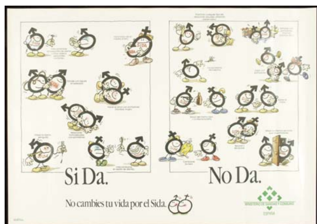
Foto 5. Cartel del Ministerio de Sanidad y Consumo. "Si Da, No Da. No cambies tu vida por el Sida". 1988.

conocimiento que tienen los españoles sobre las enfermedades de transmisión sexual, los métodos anticonceptivos y su concepción sobre el preservativo" 9 .