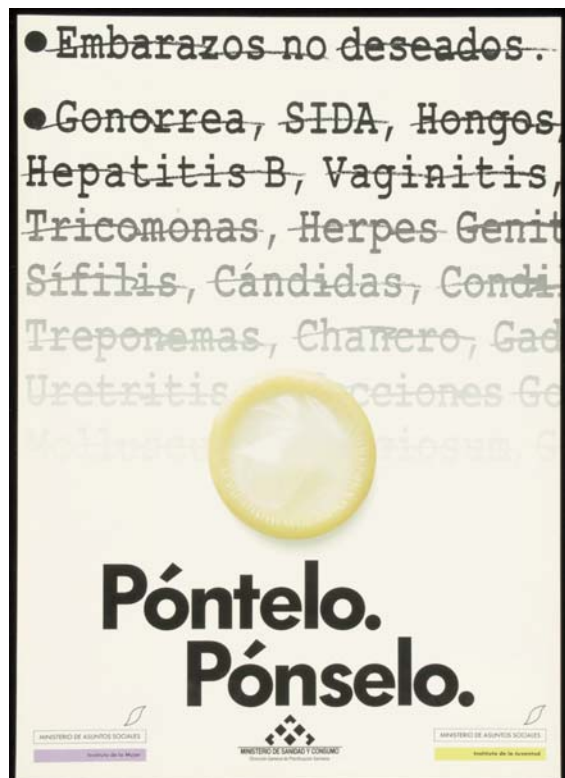
Foto 6. Campaña de publicidad del Ministerio de Sanidad. "Póntelo, pónselo".

Estas campañas publicitarias llegaron a la concienciación por parte de la opinión pública sobre la importancia del preservativo en la prevención de ETS y como dato objetivo se produjo un descenso importante