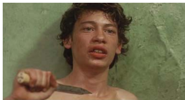
Foto 1. Caravaggio le refiere al Merchant que es una obra de arte muy costosa.

Enfermo y bajo el cuidado de los sacerdotes, el joven Michelangelo concita el interés del cardenal Del Monte, quien le aprovisionará alojamiento a la par de contactarlo con los círculos claves de aquella Roma