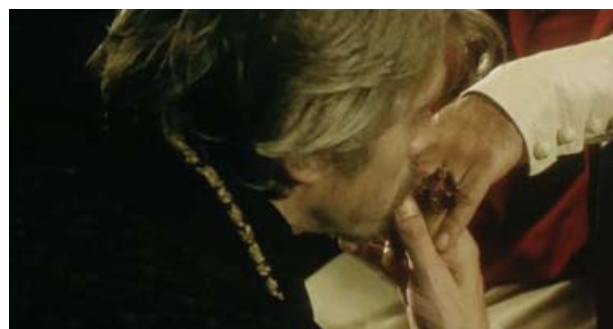
Foto 4. El encuentro con el Papa Pablo V.

Sobre el final asistiremos a una procesión de penitentes, y visiones de su niñez para luego ingresar a un ámbito donde alterna la escena que dio lugar al lienzo sobre el descendimiento de la cruz y Caravaggio muerto con un rosario entre sus manos.