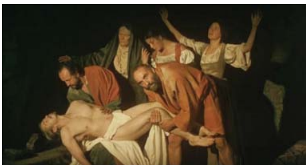
Foto 6. La deposición de Jesús.