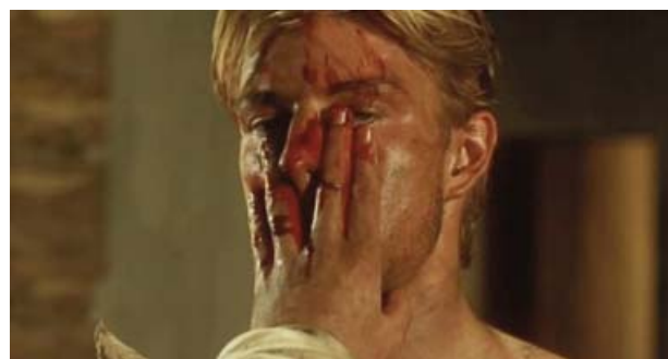
Foto 3. Las manos ensangrentadas de Caravaggio en el rostro de Ranuccio.

Resulta claro que tanto Ranuccio como Lena también se sienten atraídos hacia Michelangelo, a la vez que sienten celos uno del otro por las atenciones dispensadas por el artista. Lena llega incluso hasta recriminarle a Ranuccio su enamoramiento de Michelangelo.