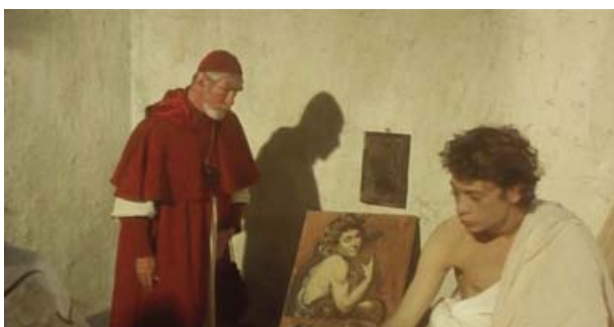
Foto 2. El encuentro con el Cardenal Del Monte.

finisecular (foto 2). La preocupación del Cardenal por hacerlo crecer intelectualmente aparece reflejada durante una escena en el dormitorio del Prelado, en la que Caravaggio lee un pasaje sobre Giordano Bruno a la par que Del Monte le refiere una cita de Heráclito vinculada al escrito de Bruno. El Cardenal le refiere las fuertes críticas hacia Bruno puesto que ideas como la suya harían que las estrellas inmóviles de Aristóteles se precipitaran sobre la tierra y hacer tambalear al mundo entero.