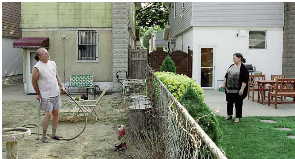
... necesita apoyo de un bastón.