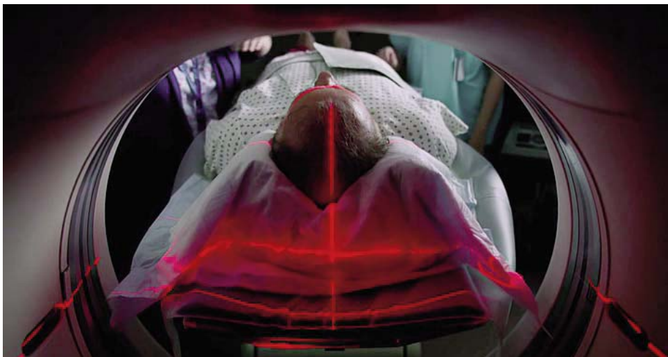
... a consecuencia de la cual es ingresado en un hospital, donde se le practica un TAC...