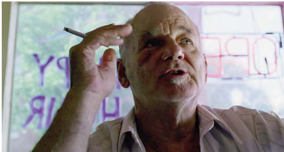
Un varon de edad avanzada, fumador...