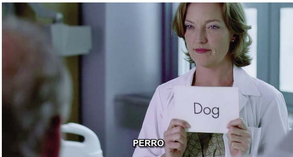
Inmediatamente comienza la rehabilitación logopédica,...