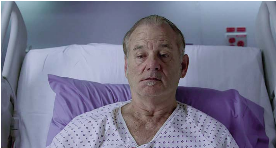
...desviación de la comisura labial derecha,...