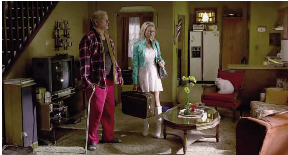
Es dado de alta con una hemiparesia derecha residual (contralateral) para la que...