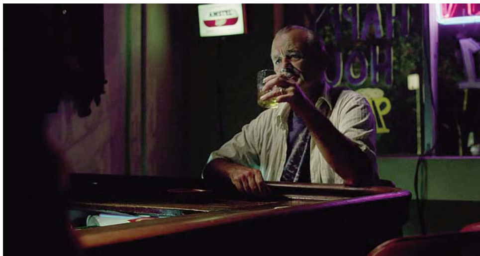
...de vida sedentaria y desordenada,...