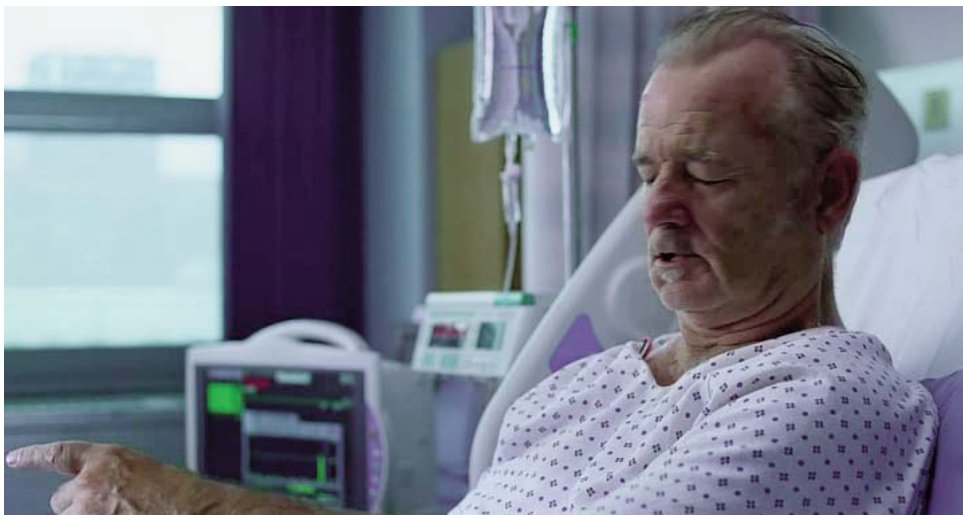
...dificultad en el habla,...