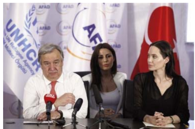
Foto 8. La actriz Angelina Jolie en una reunión con el alto comisionado de la ONU para los refugiados.

En definitiva, distribuir los aglomerados humanos en las fronteras solamente tendrá un efecto paliativo. La inmigración en masa solamente acabará cuando los ciudadanos de los países pobres adquieran condiciones de vida mínimamente saludables en sus locales de origen.