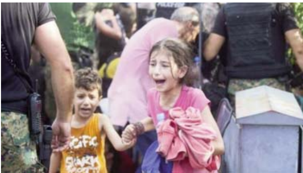
Foto 5. Niños sirios inmigrantes corren después de la represión policial.

acuerdo con su edad. Antes de los seis años aun no tienen la noción de la influencia de terceros en sus vidas, entonces se sienten culpables, pensando que si hubiesen sido obedientes por ejemplo, nada de eso (guerra o desastre) hubiera ocurrido. Tienen, también, dificultad para dormir, pesadillas y mal comportamiento. De los siete a los once años ya entienden la perspectiva del otro y precisamente por eso sienten más miedo y ansiedad. Pueden mostrar regresión, estado de hiper alerta y rumiación del hecho traumático. Los adolescentes con frecuencia guardan para si sus sentimientos lo que aumenta la depresión. Suelen tener, también, sensaciones de injusticia con deseo de venganza lo que los hace más susceptibles a la influencia de terroristas y delincuentes 1 .