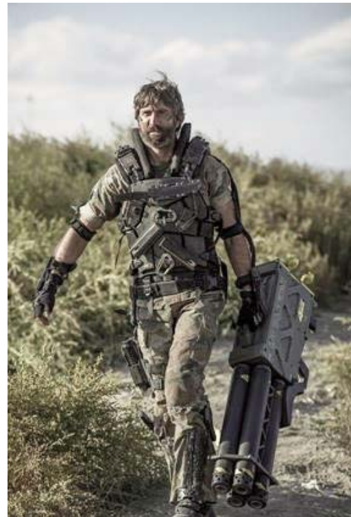
Foto 7. Algunos grupos de mercenarios o terroristas de los países pobres, reciben armas y apoyo de los países ricos.

Neil Blomkamp tuvo la inteligencia de dirigir actores norteamericanos, mejicanos, brasileños y africanos, quizás para recordarnos que existen talentos en todos los países. Blomkamp es un veterano en el tema, su anterior