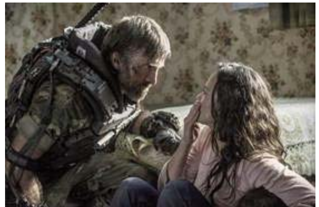
Foto 6. Las mujeres sufren riesgos adicionales en las guerras y desplazamientos humanos.

Las mujeres, como claramente se muestra en la película, sufren riesgos adicionales en las guerras y en los desplazamientos humanos forzados, como violencia, violaciones y el caer en redes de tráfico para comercio sexual 10 (Foto 6).