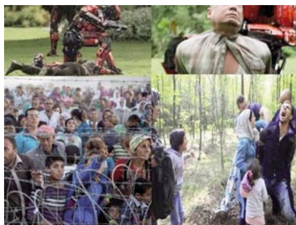
Foto 3. Similitud entre el trato recibido por invasores de Elysium e inmigrantes Sirios.

Ortega y Gasset llama a esto de heroicidad pues define a los héroes como aquellos “ decididos a no contentarse con la realidad ” 3 , aquellos que contra todo y contra todos deciden su propio destino. Sin embargo, cuando los inmigrantes actuales intentan recobrar su salud y su dignidad en otro país, son recibidos muchas veces con menosprecio. No son infrecuentes el alambre de espino, los gases lacrimógenos, las persecuciones y las detenciones. Parece que nuestro sistema, al igual que el de Elysium, tampoco reconoce como ciudadanos a esos individuos (Foto 3). La Organización Mundial de la Salud (OMS) tiene por principio que la salud es un derecho humano fundamental del que deben disfrutar todos los seres humanos sin discriminación alguna. Los grupos vulnerables y marginados de la población requieren atención prioritaria 4 .