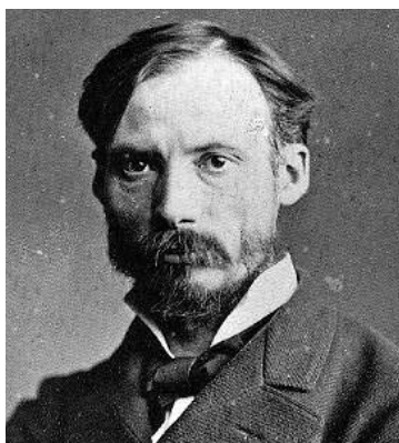
Foto 1. Pierre Auguste Renoir en su adultez.

Pierre-Auguste Renoir, uno de los pintores más importantes de todos los tiempos, nació en el año 1841 en Haute-Vienne, Limoges (Francia), de padre sastre y madre costurera. Siendo el sexto de siete hermanos (Foto 1).