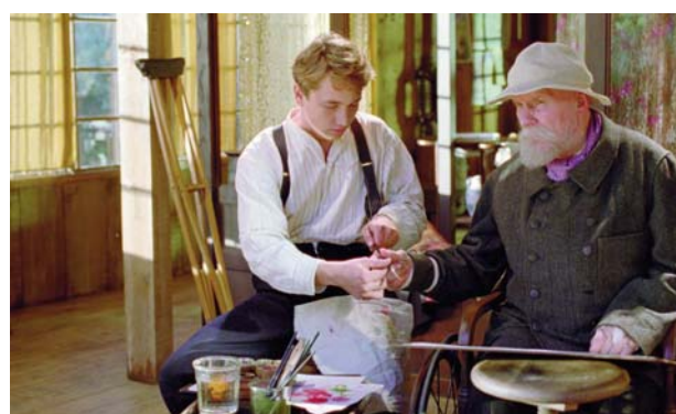
Foto 5. Renoir y su hijo Jean.