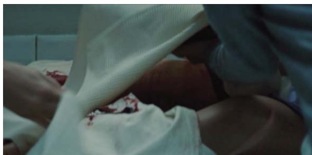
Foto 3. Muerte neonatal.

Si se intenta dilucidar la causa obstétrica de la muerte materna y neonatal, el cuadro podría encajar en la ocurrencia de hipertonía uterina seguida de una ruptura uterina espontánea con resultados fatídicos para el binomio materno-fetal. Podría destacarse la falta de vigilancia estrecha de una paciente de alto riesgo obstétrico mostrada en el filme, así como la respuesta tardía por parte del personal médico lo cual es crucial para el manejo de esta entidad.