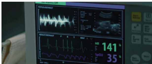
Foto 1. Elevación de la frecuencia cardiaca materna.

abrupta de la frecuencia cardiaca materna y se evidencia sangrado transvaginal de inicio espontáneo con coloración rojo brillante moderada, posteriormente se agrega trabajo de parto pretérmino precipitado, con muerte neonatal del producto. En la siguiente escena, se explica por parte de los médicos tratantes la muerte materna secundaria a 'hemorragia interna masiva', sin proporcionar información más detallada sobre el caso (fotos 1-4).