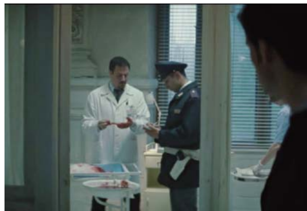
Foto 4. Causa de muerte materna 'hemorragia interna', hemorragia obstétrica.

Si se intenta dilucidar la causa obstétrica de la muerte materna y neonatal, el cuadro podría encajar en la ocurrencia de hipertonía uterina seguida de una ruptura uterina espontánea con resultados fatídicos para el binomio materno-fetal. Podría destacarse la falta de vigilancia estrecha de una paciente de alto riesgo obstétrico mostrada en el filme, así como la respuesta tardía por parte del personal médico lo cual es crucial para el manejo de esta entidad.