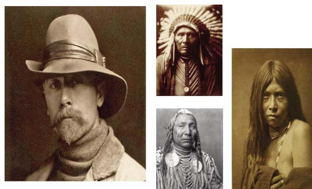
Foto 1. Edward Curtis (1868-1958).

artística observó y fotografió a más de ochenta grupos indígenas del Norte de Estados Unidos. Al respecto de su trabajo Curtis manifestó: “La muerte de cada hombre o mujer significa el fin de alguna tradición, de algún conocimiento o rito sagrado que sólo ellos poseen. Por lo tanto, la información que pueda ser recopilada para el beneficio de generaciones futuras, respetando el modus vivendi , debe recogerse ahora o la oportunidad se perderá para siempre” 5 .