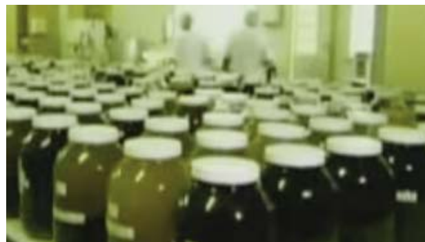
Foto 7. En el laboratorio de los hospitales espirituales se mezclan diversidad de hierbas, para producir remedios, los cuales, son almacenados en grandes frascos, que finalmente, son entregados en pequeñas dosis a los enfermos.