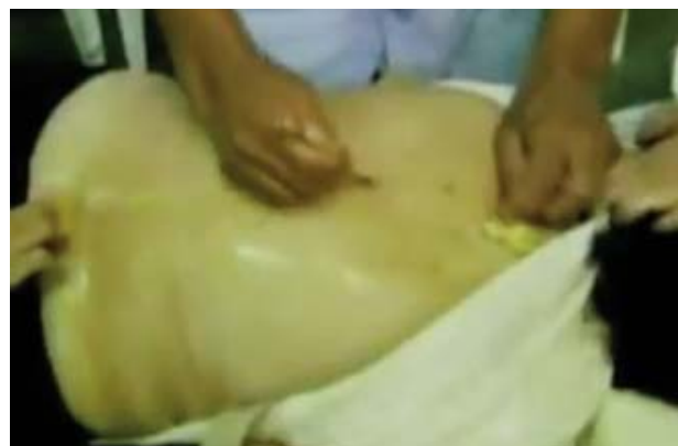
Foto 6. Los médicos espiritistas simulan una intervención quirúrgica, en la que sólo tocan o rozan la piel del enfermo con un bisturí, el enfermo cree con total devoción y convencimiento en la efectividad del procedimiento como medio seguro hacia la sanación de su dolencia.