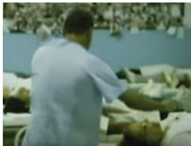
Foto 1. Los médicos espiritistas transmitiendo a los enfermos –que reposan en camillas– el fluido espiritual que los sanará.

saber: la existencia de una fuerza espiritual superior, el perfeccionamiento del alma y la comunicación entre los dos planos de la vida humana, el plano material y espiritual . Los enfermos son acostados en camillas, mientras, los médicos espiritistas ponen sus manos sobre ellos, bajo el presupuesto de hacer una cirugía espiritual (foto 1), que tiene como fin, transmitirle al enfermo fluido vital o fluido espiritual , para curar la dolencia del enfermo, como si se tratara de una transfusión sanguínea que le salvará la vida.