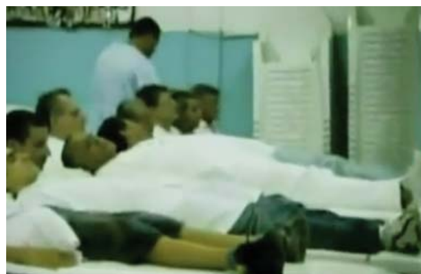
Foto 3. Hospital espiritual en donde los enfermos esperan acostados en camillas la sanación mágica a sus enfermedades.

En un cuarto momento, el documental nos traslada de nuevo a Brasil, a los médicos espiritistas, quienes utilizan la expresión hospital espiritual , para referirse al lugar de reunión en donde realizan las cirugías espirituales . En estas cirugías no se hacen intervenciones quirúrgicas sobre el cuerpo porque la causa de la enfermedad es en última instancia espiritual (Foto 3), así ésta tenga una manifestación física. Básicamente, las cirugías espirituales consisten en una simulación de una intervención quirúrgica, que tiene su acción reparadora en el plano espiritual –causa- y corporal –efecto- de la enfermedad. Igualmente, los médicos espiritistas dicen estar dotados de un laboratorio, en donde se producen remedios o medicinas naturales, hechas con hierbas.