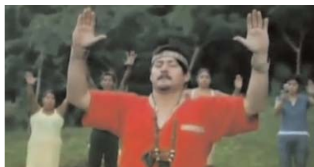
Foto 4. Enfermos participando de un ritual mágico de sanación. La sanación mágica requiere de un contexto socio-cultural que le proporcione legitimidad.

Efectivamente, las sanaciones mágicas tienen un contexto social que les proporciona legitimidad social, es