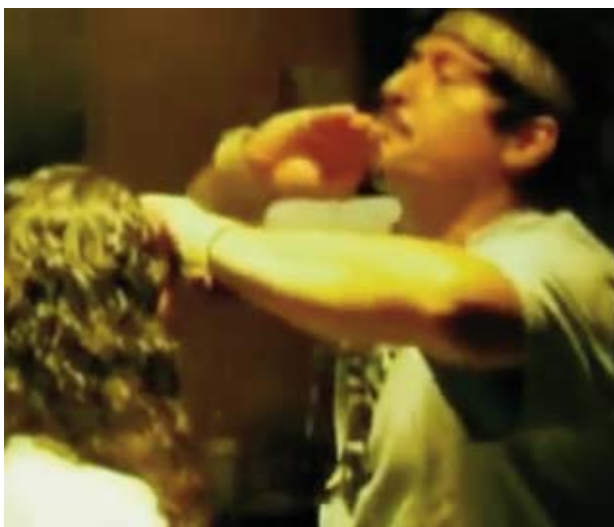
Foto 2. Chamán realizando un ritual de sanación -magia blanca- a un enfermo.

raíz última de toda enfermedad física o mental es espiritual. De este modo, la enfermedad es la manifestación de un desequilibrio espiritual del ser humano. Dentro de la ritualidad de sanación, se ven personas que se desmayan y gritan, bajo el influjo del líder espiritual, quien dice estar venciendo las fuerzas malignas –entidades espirituales- causantes de las enfermedades entre sus adeptos. Para dar prueba de su poder, el líder espiritual afirma haber llevado a cabo más de un centenar de sanaciones, al llegar a este punto, se presenta el caso de una señora de mediana edad, que desde muy joven dice haberse sentido perturbada mentalmente, ya que, escuchaba una voz en su interior que le pedía cigarrillos, igualmente, señalaba padecer desmayos y gritos descontrolados. La enferma dice nunca haber podido encontrar un diagnóstico y cura en los médicos formales de la medicina moderna, pero sí, en las sesiones de sanación del líder espiritual.