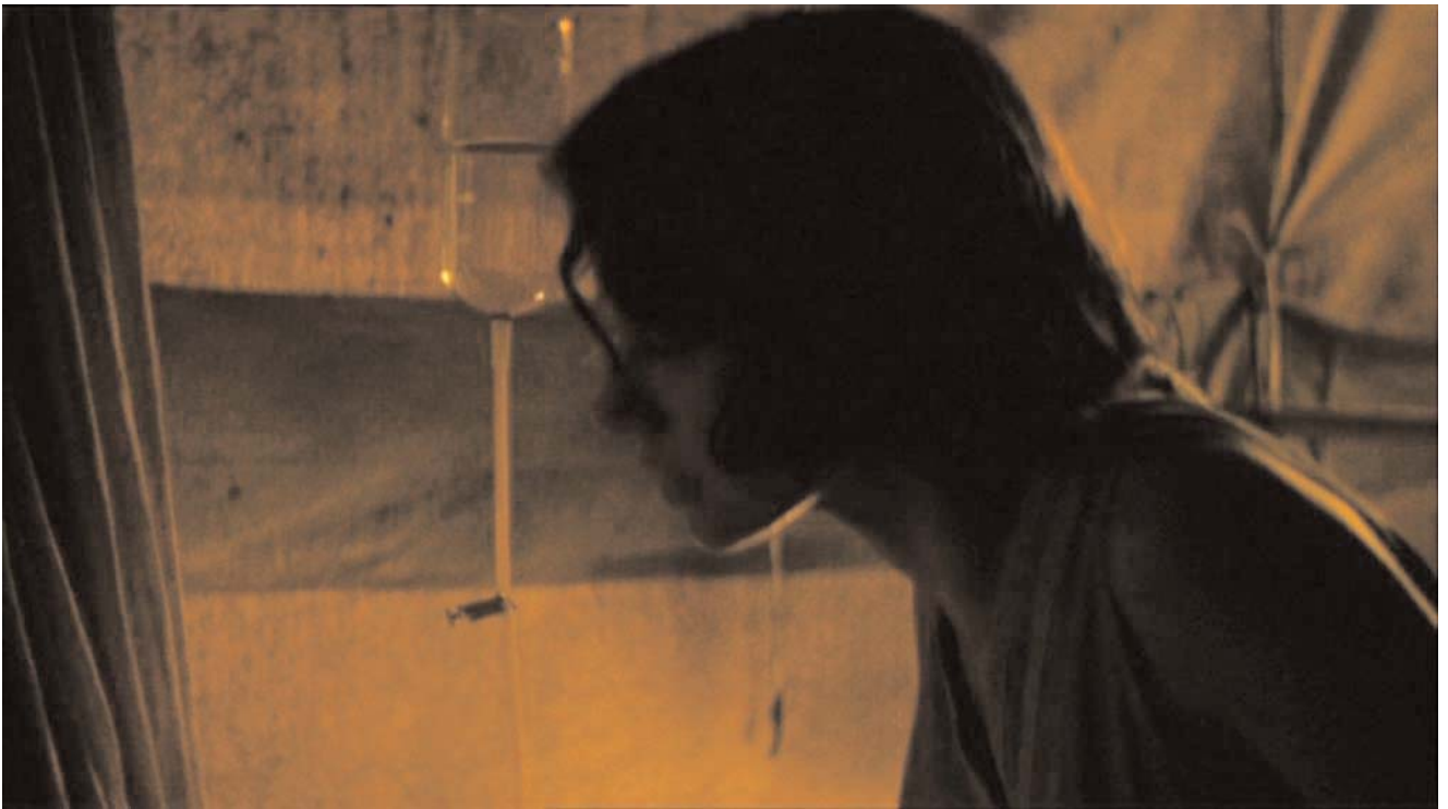
Tratamiento: rehidratación (agua y electrolitos)