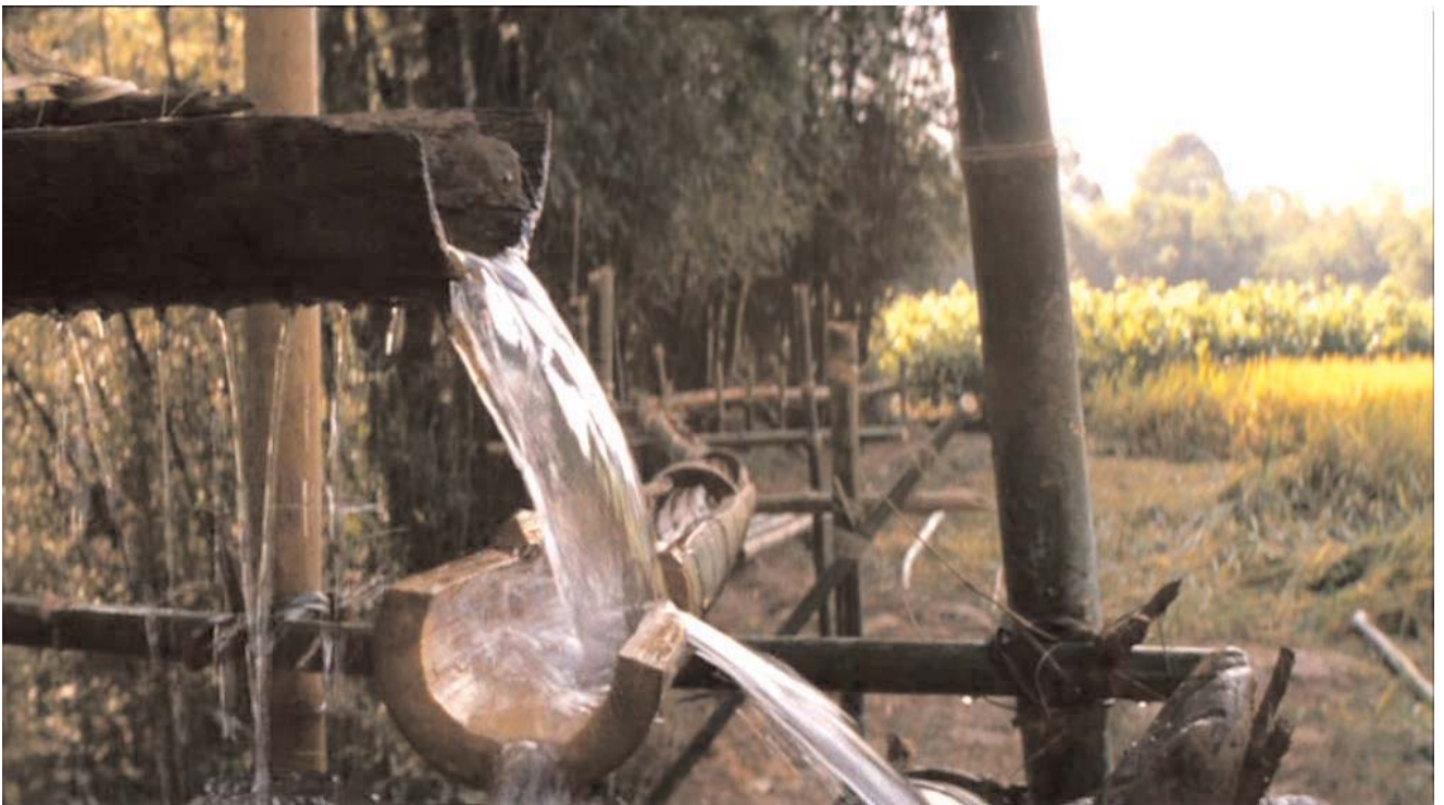
Prevención: suministro adecuado de agua