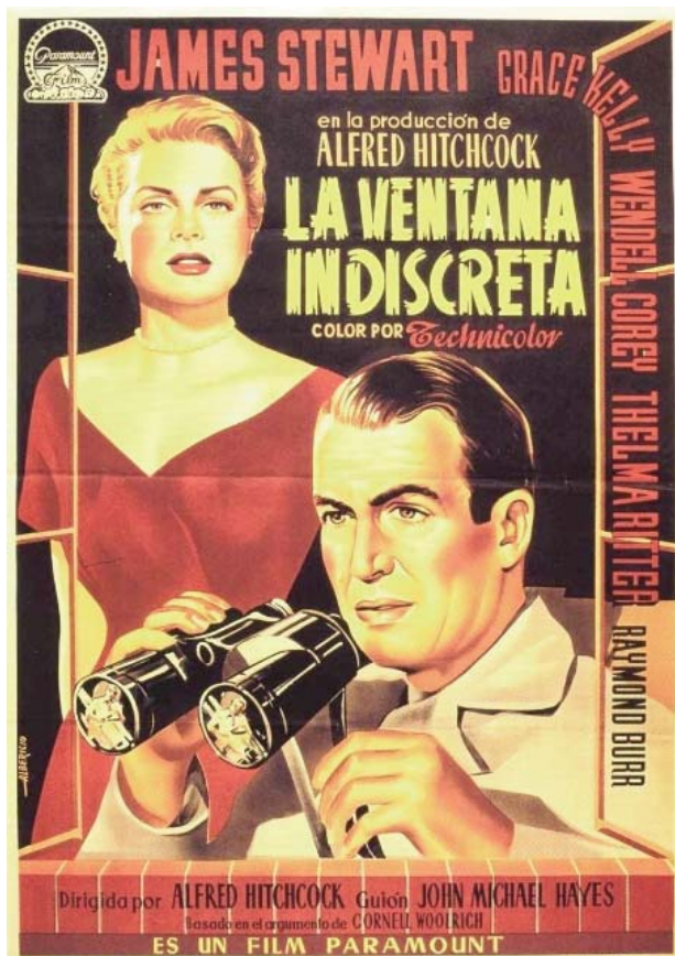
Foto 8: cartel español de La ventana indiscreta (diseño de Fernando Albericio)

pantalla, y su estimulante puesta en escena moldeada por el significante fílmico. Y es que, desde la crítica más militante, hasta la teoría más sesuda, han coincidido en ver en la película de Hitchcock un brillante paralelismo establecido entre la situación del espectador en la sala de proyección cinematográfica y el contexto ficcional en el que se encuentra su protagonista, el fotógrafo supeditado a una silla de ruedas L.B. Jeffries (James Stewart). Fenómenos analizados a lo largo del presente trabajo como la situación cinematográfica, la identificación del