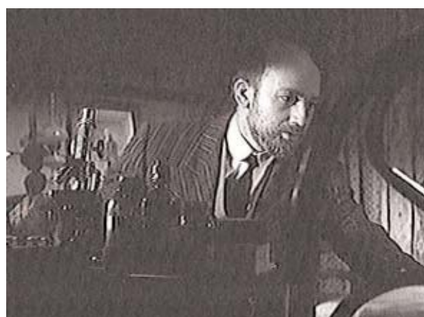
Foto 10: alegría y muerte. Cajal hace su descubrimiento en el momento que fallece su hija

A raíz de su impactante descubrimiento, hace la exposición del mismo a la comunidad científica que tiene lugar, a sus 37 años, en el Congreso de Anatomía