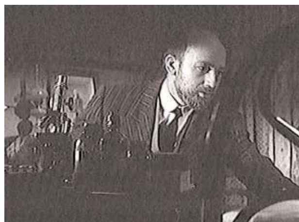
Foto 10: alegría y muerte. Cajal hace su descubrimiento en el momento que fallece su hija

A raíz de su impactante descubrimiento, hace la exposición del mismo a la comunidad científica que tiene lugar, a sus 37 años, en el Congreso de Anatomía