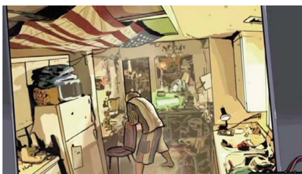
Foto 20: El respaldo de una silla puede ser suficiente para hacer una maniobra de Heimlich

Una mirada a la oscuridad/ A Scanner Darkly (2006) es una película de animación realizada por rotoscopia cuya trama es un drama policiaco de intriga y ciencia ficción. El argumento es preocupante porque “suena”, la policía para proteger a los ciudadanos de las drogas los vigila, la acción transcurre en un futuro próximo en el condado californiano de Orange. Un hombre sufre una OVACE al comer, intenta practicarse a sí mismo la maniobra de Heimlich y por fin lo consigue con el respaldo de una silla (foto 20).