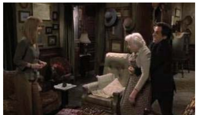
Foto 15: Alex levanta del sillón a la señorita Connelly y le realiza la maniobra de Heimlich en Duplex