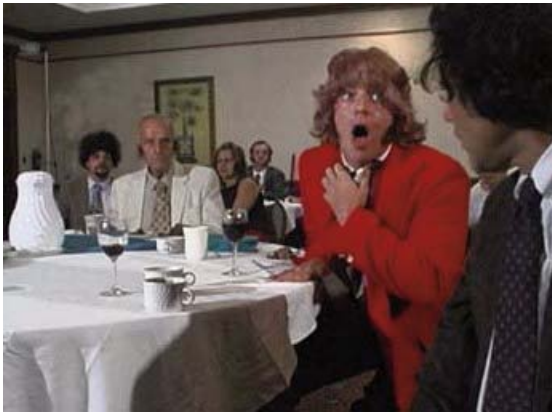
Foto 22: el atragantado se lleva las manos al cuello en The History of Choking