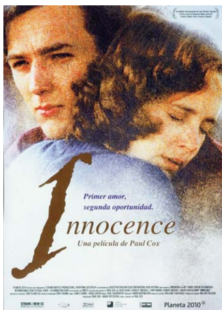
Época del rodaje y cincuenta años antes (Australia y Bélgica) Cartel español