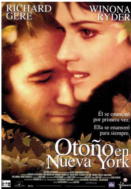
Época del rodaje (Vancouver, Canadá) Cartel español