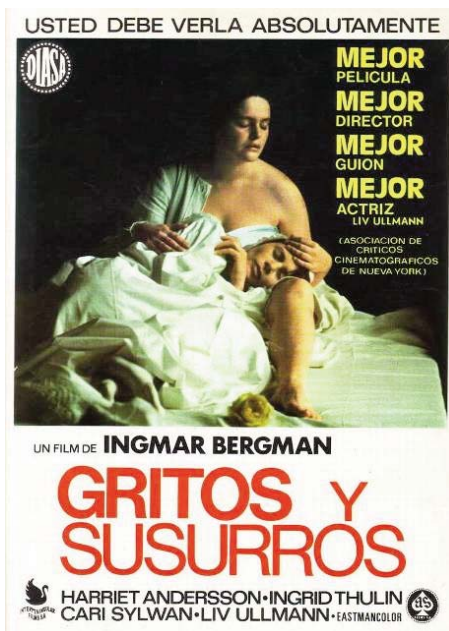
Finales del siglo XIX (Suecia) Cartel español

Título: Vive hoy para mañana Título original: An Act of Murder País: Estados Unidos Año: 1948 Director: Michael Gordon Música: Daniele Amfitheatrof Guión: Michael Blankfort y Ernst Lothar (novela). Intérpretes: Fredric March, Edmond O'Brien, Florence Eldridge, Geraldine Brooks, Stanley Ridges, John McIntire, Frederic Tozere, Will Wright, Virginia Brissac, Francis McDonald y Mary Servoss. Color: blanco y negro Duración: 91 minutos Género: drama Productora: Universal International Pictures (UI) Comentario: Catherine Cooke (Florence Eldridge) (en el centro abajo) sufre un tumor cerebral terminal.