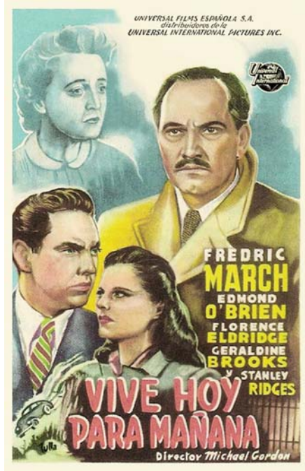
Primera mitad del siglo XX (Estados Unidos) Programa de mano español de Tulla