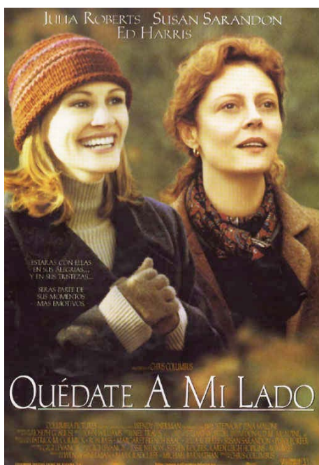
Época del rodaje (Estados Unidos) Cartel español