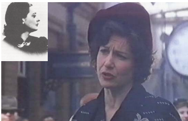
Foto 2: Helen Joy Davidman en la realidad y en Tierras de penumbra interpretada por Debra Winger