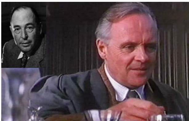
Foto 1: C.S. Lewis en la realidad y en Tierras de penumbra interpretado por Anthony Hopkins